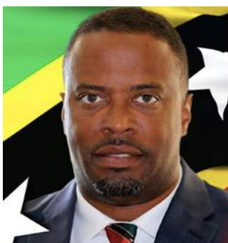
Марк Брентли Министр Иностранных Дел Сент-Киттс и Невис