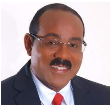
Гастон Браун Премьер-министр Антигуа и Барбуда