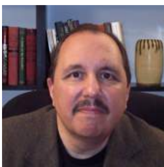
Пол Розенберг Cryptohippie