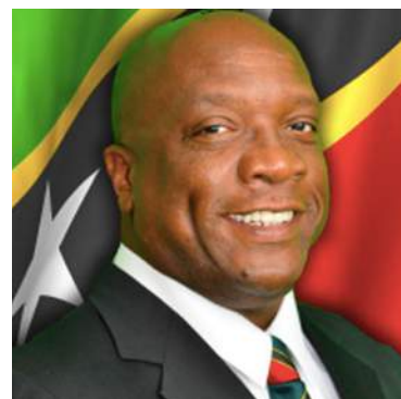
Химоти Харис Премьер-министр Сент- Киттс и Невис