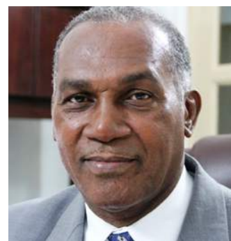
Ванс Эмори Премьер о.Невис